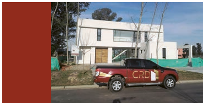
■ Gestión de proyectos llave en mano.

■ CRD Construcciones es una empresa compuesta por un grupo de profesionales que se especializa en la realización de proyectos en áreas como la construcción industrial, comercial y residencial, bajo estrictos estándares técnicos.